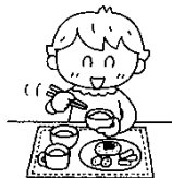
朝ご飯いただきまーす!